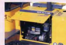
写真のキャブはオプションです。

ワンタッチで開閉できるガススプリング付の大型サイドパネルを採用。開口部が広く、エンジン回りの日常点検・整備が容易に行えます。